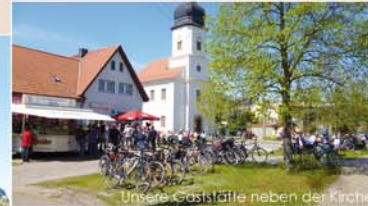
Unsere Gaststätte neben der Kirche